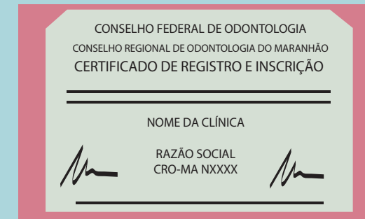
Certificado de Registro (imagem ilustrativa)

Todo estabelecimento que tenha assistência odontológica como atividade econômica, ou que possua em seu nome qualquer termo referente à Odontologia, deve estar registrada no CRO .